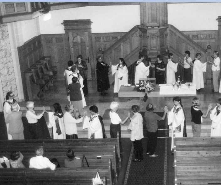
Das war ein ganz besonderer Gottesdienst. Es konnte sogar getanzt werden.