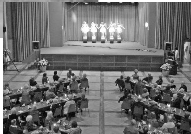
Das war ein Höhepunkt im Wipkinger Gemeindeleben: die Neujahrsbegrüssung mit dem Kinderzirkus Robinson.