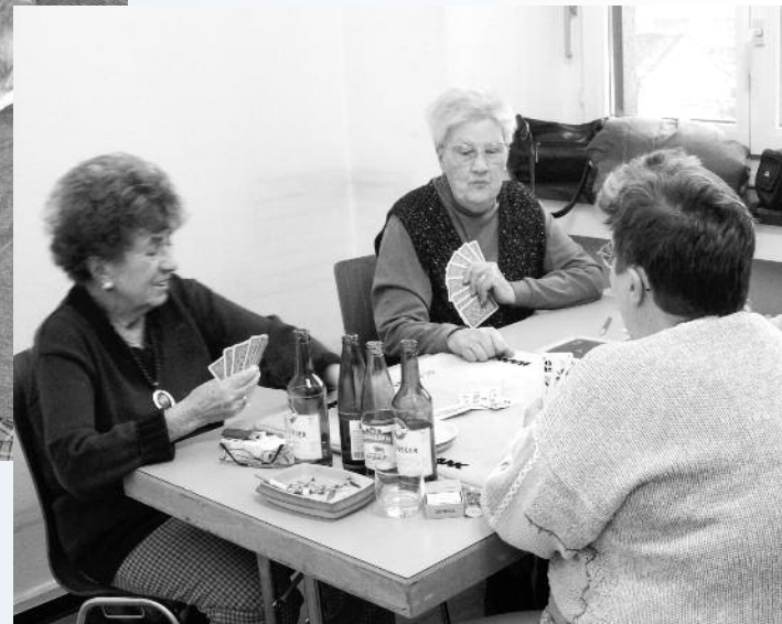
Gemütliche Jassrunden durften natürlich auch nicht fehlen!