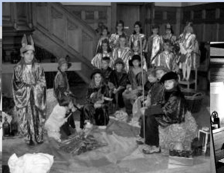
Die Kolibri-Weihnachtsfeier war ein Gottesdienst für die ganze Familie und fand grossen Anklang.