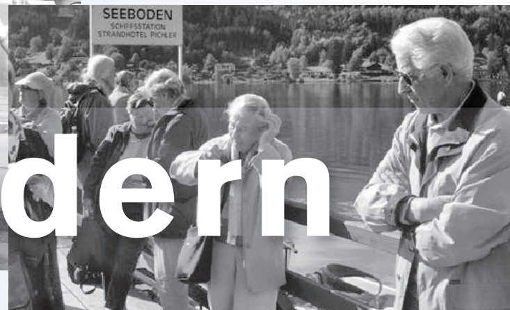
In den Gemeindeferien konnte man sich offensichtlich gut erholen.