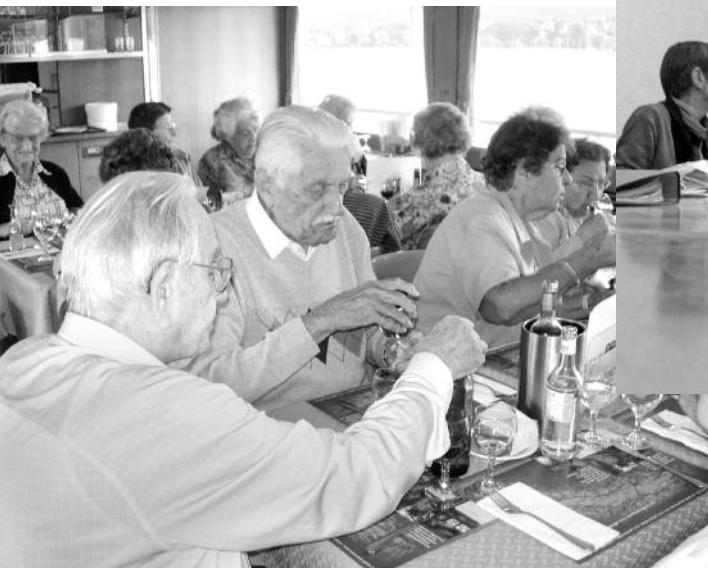
Für einmal fand der Mittagstisch nicht im Kirchgemeindehaus statt, sondern auf einem Zürichseeschiff.