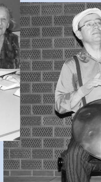
Originelle musikalische am Fest für die Freie