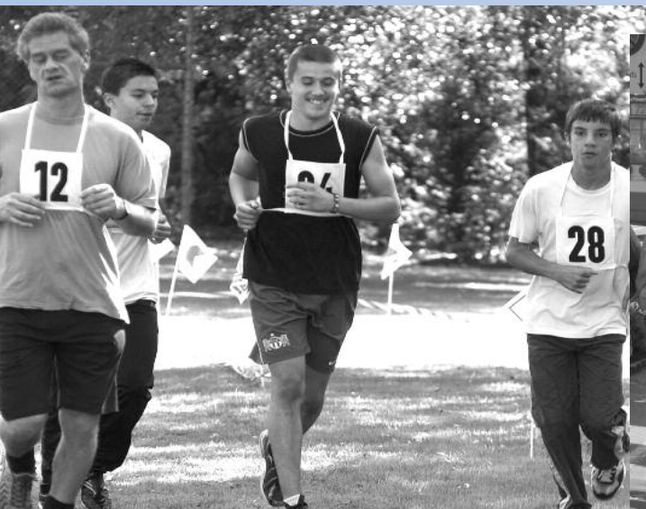
Sie drehten manche Runde am Sponsorenlauf zugunsten der Projekte der OeME-Gruppe.