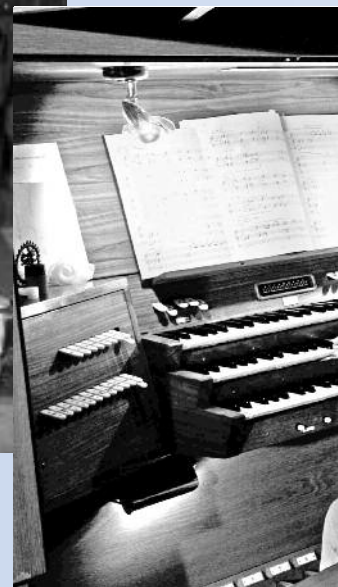
Zu den Konzerten von Susa viele Menschen – nicht nur