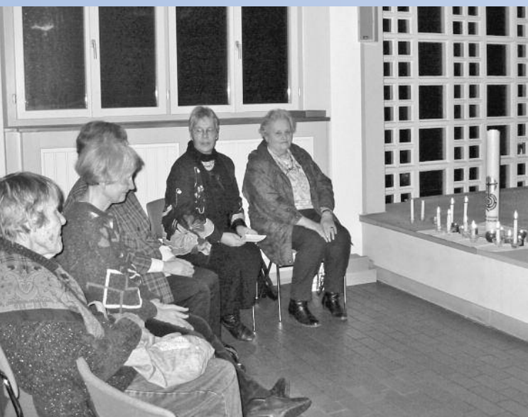
In der Lettenkirche fand jeden Mittwoch das Friedensgebet statt.