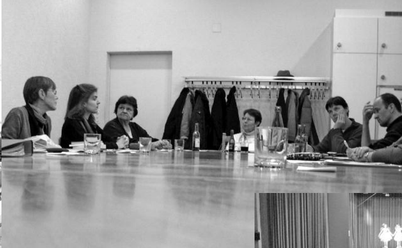
Die Kirchenpflege an der Arbeit. Es wird eifrig diskutiert und sorgfältig überlegt, bevor die Beschlüsse gefasst werden.