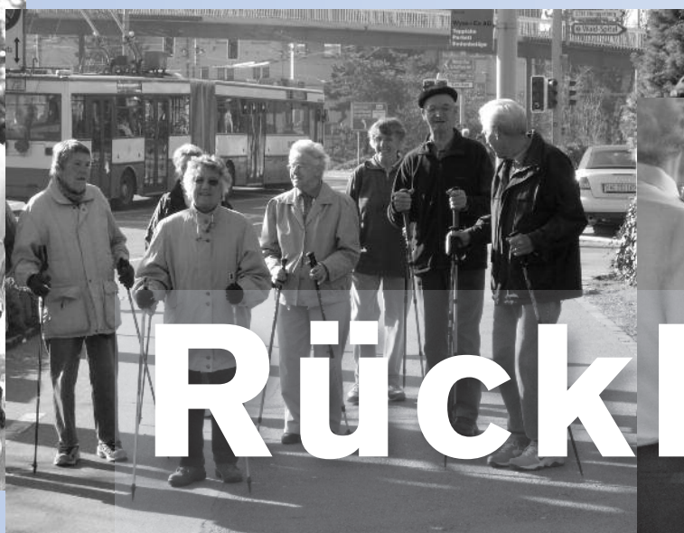
Startbereit fürs Walking auf den Käferberg.