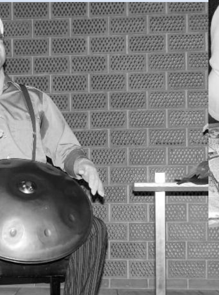
Die Unterhaltung gab es willigen der Gemeinde.