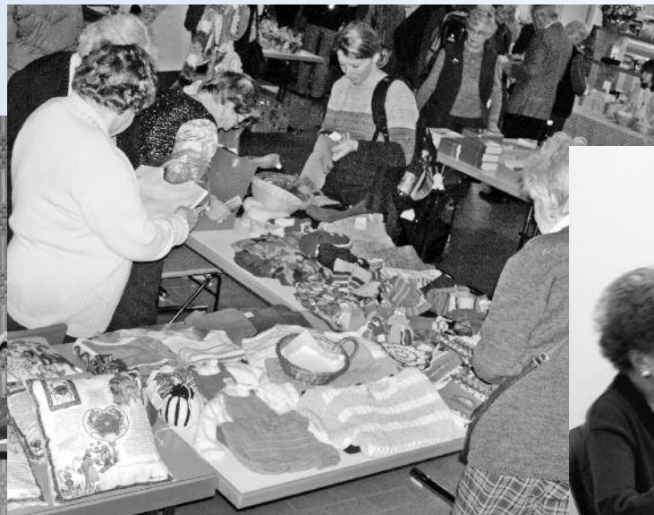
Das bunte Angebot unseres alljährlichen Basars.