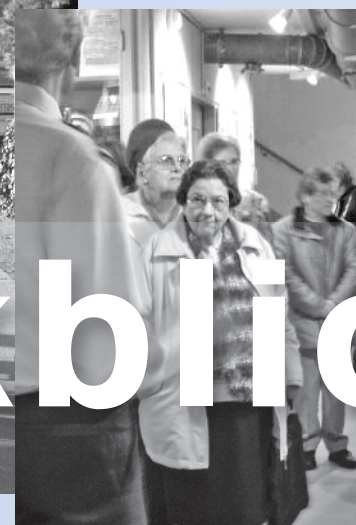
Eine Führung durchs Ziv das in unserer Gemeinde